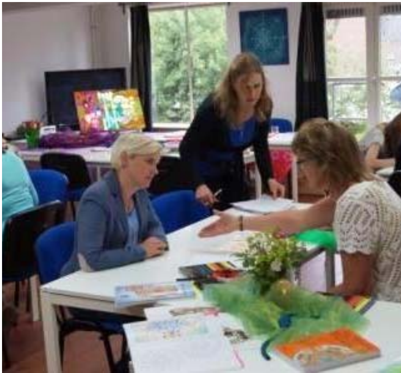
Tijdens de oefensessies in De Kolam