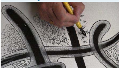
Het zelfhelend vermogen ontwikkelen